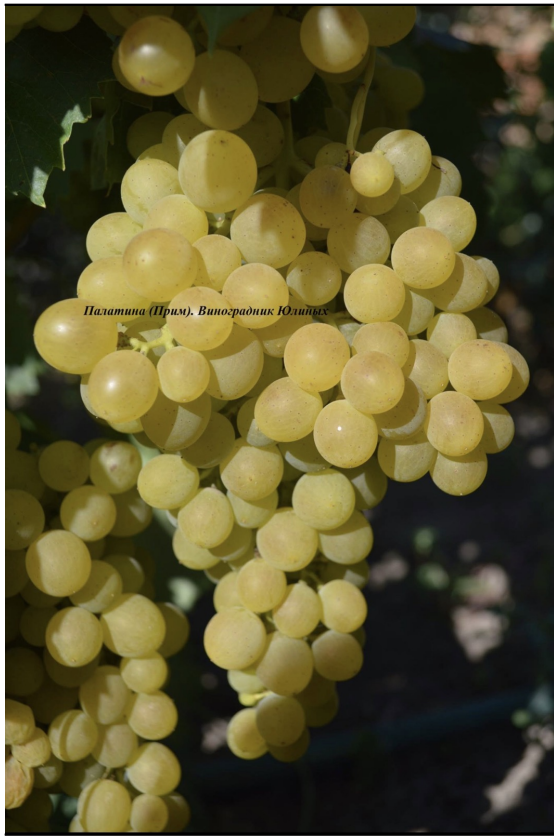
Палатина (Прим), Виноградник Юліїних