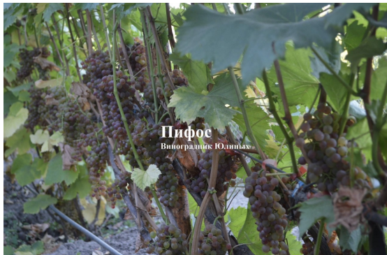
Пифос Виноградник Юліїних